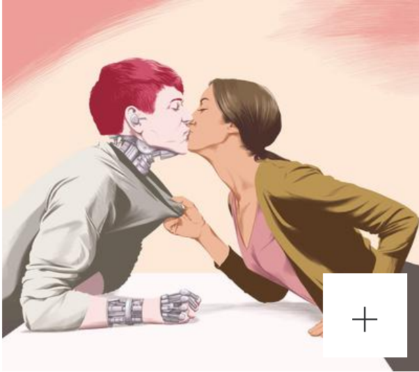
Illustration Paul Grelet

lecteurs qui disait ceci : Quand mon aspirateur robot s'arrête au milieu du salon, à quoi pense-t-il ?... Eh oui, nous sommes des animaux sociaux et, quand nous sommes seuls, nous nous inventons des objets transitionnels et leur donnons des noms», poursuit l'universitaire. Le secteur de la publicité a très bien compris cette démarche. Une Alpha Romeo est ainsi vendue comme une maîtresse. «Regarde-moi, possède-moi, contrôle-moi, exalte-moi,