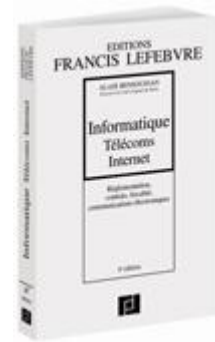
Informatique, Télécoms, Internet , Editions Francis Lefebvre 5e éd. 2012

▪ Les mises à jour apportées à l'édition 2012 de l'ouvrage Informatique, Télécoms, Internet sont disponibles en ligne .